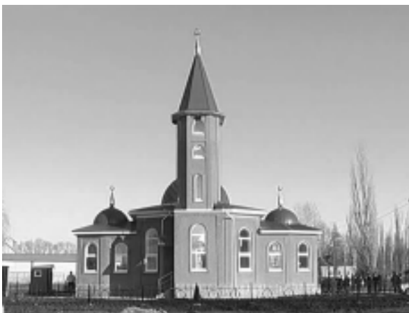
Щынджые къыщызэуахыгъэ мэщытым итеплэ

Адыгэ Республикэм ыкӀи Пшызэ шӀольыр ащыцэуэр быслымэнхэм ямуфтнеу ЕМЫЖ Нурбий